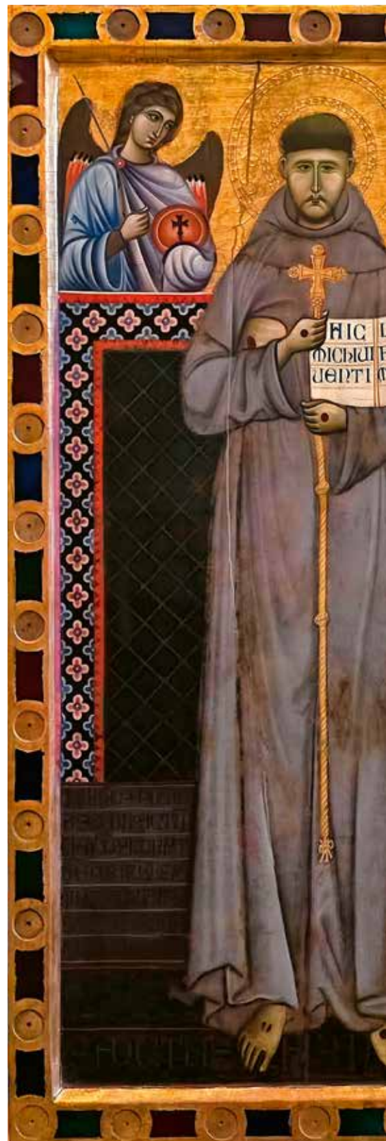
Icono con el que la Familia Franciscana inauguró el Octavo Centenario del Tránsito de San Francisco en la Porciúncula.

Depósito legal: B-26306-05. Imprime: Gráficas Dehon. C/ Morera 23-25. 28850 Torrejón de Ardoz (Madrid). © No se permite la reproducción total o parcial de artículos y fotografías sin una autorización expresa de la dirección de la revista, que se publica, trimestralmente, en los meses de marzo, junio, septiembre y diciembre.